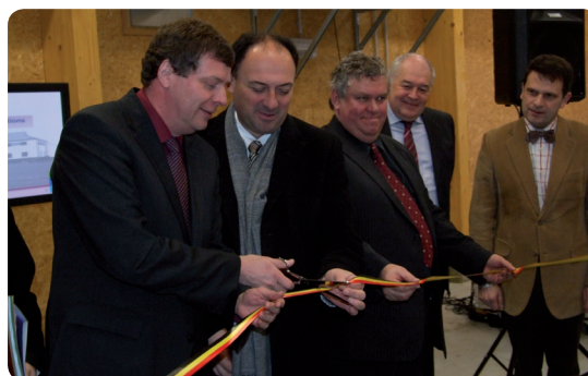
Les autorités coupent le ruban tricolore

L'inauguration orchestrée par l'intercommunale BEP s'est faite le 27 janvier dernier. Nous sommes à nouveau prêts pour continuer à répondre aux demandes des créateurs à travers nos autres services telles que le « Test grandeur nature » ou le « Village des créateurs ® ».